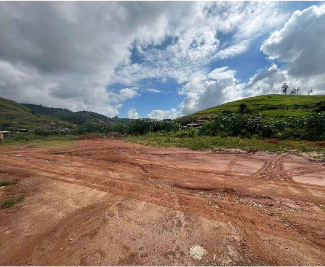
IMAGEM 01 - IMAGEM LATERAL ESQUERDA DO TERRENO PARA CONSTRUÇÃO DA QUADRA POLIESPORTIVA DA E.M.BRENDA GUIMARÃES DE PAULA